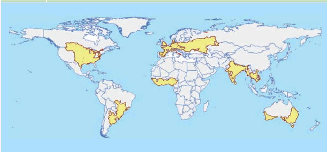
全球制图报告单元 (MRU)