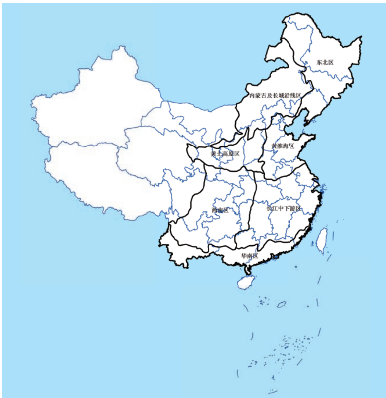
国家（一级行政区，州和省等）